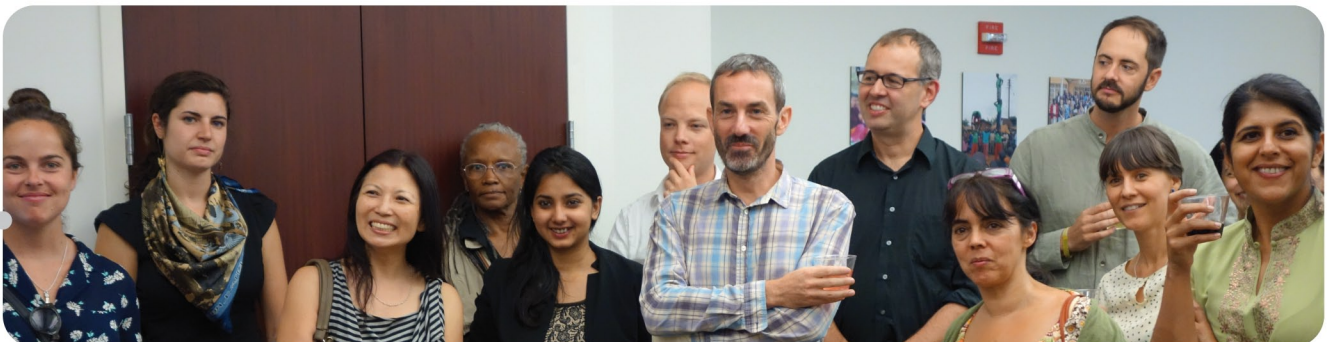
En septembre 2014, le Réseau-DESC a organisé une journée portes ouvertes pour accueillir des membres et sympathisant-e-s dans notre nouveau bureau.

Chacune de ces contributions est essentielle pour bâtir un mouvement mondial visant à faire des droits humains et de la justice sociale une réalité pour tous et toutes.